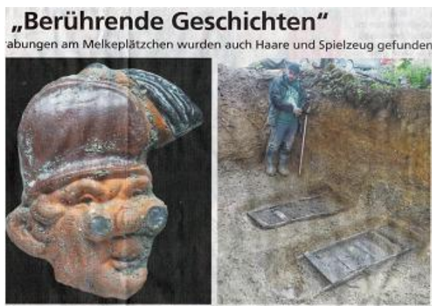
Der Patriot (Lippstadt), 19.06.2020 46