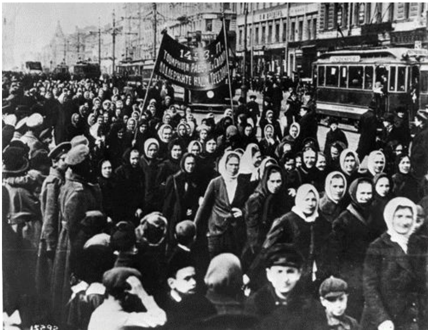
Petrograd 1917 20

8.3.1914. Rosa Luxemburg und Clara Zetkin wollten wählen dürfen, und sie wollten Krieg verhindern bzw. beenden, und viele andere Frauen auch. 1917 International Women's Day - Petrograd “ und „8 March 1917“ steht in dem Wikipedia-Artikel zum „Weltfrauentag“ zu dem folgenden Photo geschrieben: