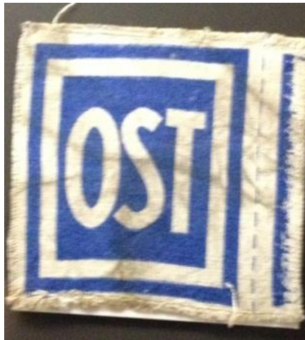
Kennzeichen „OST“ 32

Was steht auf ihrem Grab, dem Grab der „OST“-Arbeiterin bei